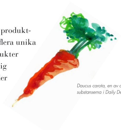
Daucus carota, en av de aktiva substanserna i Daily Detox.

”En kontinuerlig investering i vår egen produktutveckling betyder att vi redan nu har flera unika och innovativa, färdigutvecklade produkter på gång. Produktutveckling är en viktig del av vår långsiktiga strategi och betyder mycket för vårt marknadsvärde.”