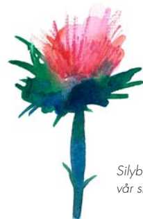
Silybum marianum förstärker vår storsäljare BioDrain.

”Vi jobbar hårt för att utnyttja de fantastiska möjligheter som just nu finns för tillväxt och konsolidering på den internationella marknaden. Vårt fokus under de närmaste åren, kommer vara att skapa en global verksamhet. Vinst är viktigt, men tillväxt och globalisering kommer att vara ännu viktigare under de kommande åren.”